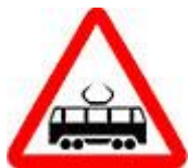
Знак 1.5 - Пересечение с трамвайной линией.

Мы сейчас поступим следующим образом. Расставим на дороге все предупреждающие знаки и будем по очереди проезжать их. А начнём со знака 1.5 «Пересечение с трамвайной линией». Знаки 1.1. – 1.4.6, оформляющие подъезд к железнодорожному переезду, пока отложим. Мы вернёмся к ним позднее и уже тогда поговорим о них самым подробным образом.