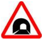
Знак 1.31 – Тоннель.

В тоннеле движение осуществляется в условиях ограниченного пространства и при отсутствии дневного света, а, значит, в условиях с худшей видимостью. При этом наиболее опасным местом тоннеля является именно въезд.