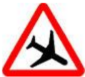
Знак 1.30 – Низколетящие самолёты.

При движении по такому участку, задача водителя – снизить скорость и следить за тем, как ведёт себя машина.