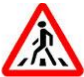
Знак 1.22 – Пешеходный переход.

И, конечно же, встречных тоже предупредили знаками – Внимание! Временно на вашей проезжей части организовано двустороннее движение!