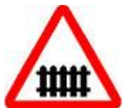
Знак 1.1 - Железнодорожный переезд со шлагбаумом.

Вы, конечно, читали (видели, слышали) к каким тяжким последствиям приводят практически все ДТП на переездах. Закономерно, что Правила содержат ряд требований, устанавливающих порядок движения на самих переездах и вблизи них. Мы будем знакомиться с этими требованиями постепенно в течение настоящего курса, сейчас же наша задача – разобраться с тем, как обустраиваются железнодорожные переезды и как оформляются подъезды к ним.