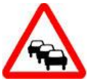
Знак 1.32 – Затор.

К знаку могут добавить уже известную нам табличку 8.2.1 «Зона действия», чтобы дополнительно сообщить водителям длину тоннеля.