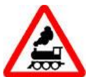
Знак 1.2 - Железнодорожный переезд без шлагбаума.

Шлагбаумы устанавливаются с обеих сторон железнодорожных путей, и в этом случае зона железнодорожного переезда – это расстояние между шлагбаумами.