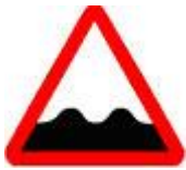
Знак 1.16 - Неровная дорога.