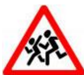
Знак 1.23 – Дети.

Знаки пешеходного перехода совсем другие – квадратные, с синим фоном, и стоят они непосредственно на границах перехода.