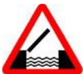
Знак 1.9 - Разводной мост.

Но мы к этому уже подготовлены. Спасибо предупреждающему знаку.