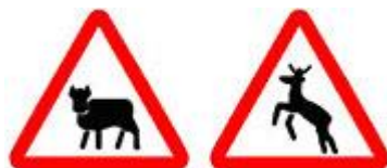
Знак 1.26 – Перегон скота. Знак 1.27 – Дикие животные.

Будьте внимательны, особенно в тёмное время суток.