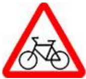
Знак 1.24 – Пересечение с велосипедной дорожкой.