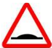
Знак 1.17 – Искусственная неровность.

Таким знаком вас информируют о том, что в местном бюджете нет денег на ремонт дороги. И они честно вас об этом предупредили. Ну, что же, если хотите поберечь колёсные диски и подвеску, лучше снизить скорость.