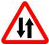
Знак 1.21 – Двустороннее движение.

Можно проехать всю Россию и ни разу такой знак не встретить, но дороги будут сплошь с двусторонним движением. А почему же нет знаков? Да потому, что двустороннее движение – это норма, и нет никакой необходимости как-то специально об этом предупреждать.