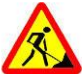
Знак 1.25 – Дорожные работы.

При этом помните: велосипедист Правил не читал, да и выпить может «за рулём». Поэтому повнимательнее и, на всякий случай, правая нога в полной готовности перенестись на педаль тормоза.