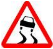
Знак 1.15 – Скользкая дорога.