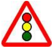
Знак 1.8 - Светофорное регулирование.

А вот покидать круг разрешено только с крайней правой полосы. И, глядя на рисунок, понятно почему.