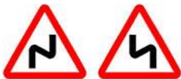
Знаки 1.12.1 и 1.12.2 - Опасные повороты.

Если поворотов сразу два, и они следуют друг за другом, о такой напасти водителей предупредят этими знаками. Необходимо понимать, чем они отличаются друг от друга. Один устанавливают на участке дороги с первым поворотом направо, а другой соответственно на участке дороги с первым поворотом налево.