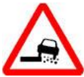
Знак 1.19 – Опасная обочина.

Снизьте скорость и по возможности увеличьте дистанцию и боковой интервал. Больше тут ничего не придумаешь.