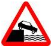
Знак 1.10 - Выезд на набережную.