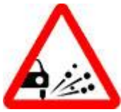
Знак 1.18 – Выброс гравия.