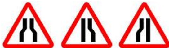
Знаки 1.20.1, 1.20.2, 1.20.3 – Сужение дороги.

Если это не так, то об этом вас предупредят знаком 1.19.