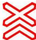
Знак 1.32 Многопутная железная дорога.

И опять сразу оговоримся - в этом случае зона железнодорожного переезда – это расстояние между этими знаками.