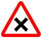
Знак 1.6 - Пересечение равнозначных дорог.