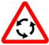
Знак 1.7 - Пересечение с круговым движением.

Но мы к этому уже подготовлены. Спасибо предупреждающему знаку.