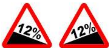
Знаки 1.13 и 1.14 – Крутой спуск и Крутой подъём.

До начала опасного участка по-прежнему 150 – 300 метров, и там дорога будет насыщена опасными поворотами, следующими друг за другом. И будет их не менее трёх. Но сколько бы их не было, общая протяжённость опасного участка известна – 500 метров.