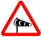
Знак 1.29 – Боковой ветер.