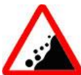
Знак 1.28 – Падение камней.

Смею ли я надеяться, что вам одинаково жалко и тех, и других?