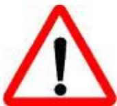
Знак 1.33 – Прочие опасности.

Такой знак предупреждает водителей о том, что впереди образовалась глухая «пробка», и сейчас ещё не поздно свернуть и попытаться счастье на другом маршруте.